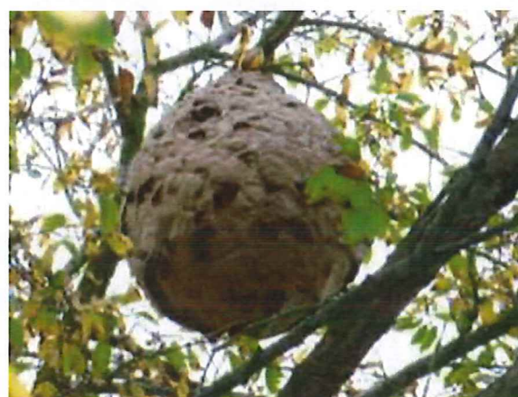
Nids secondaires à partir de l'été

Nid d'été de très grosse taille. Attention, il peut contenir plusieurs milliers de frelons. Son élimination par vos propres moyens peut être dangereuse.